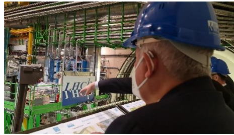
Comitiva do Governo Federal visita instalações da Organização Europeia para a Pesquisa Nuclear (CERN)