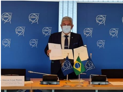
Governo Federal assina acordo de acesso do Brasil à Organização Europeia para a Pesquisa Nuclear (CERN)