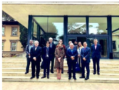
MCTI visita o Centro Nacional de Supercomputação, em Barcelona