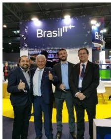
Ministério visita estande brasileiro no Mobile World Congress, em Barcelona