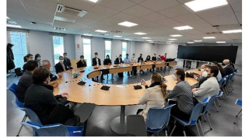
Ministro conversa com pesquisadores durante visita na Organização Europeia para a Pesquisa Nuclear (CERN)