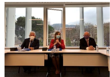
MCTI visita o Centro Nacional de Supercomputação, em Barcelona