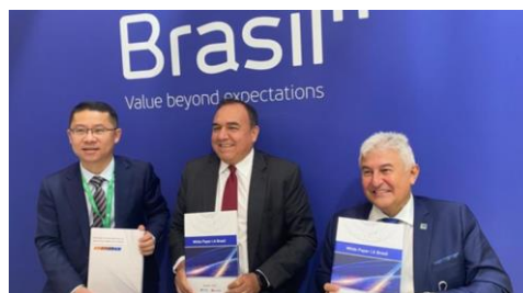
Ministério visita estande brasileiro no Mobile World Congress, em Barcelona