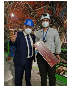
Comitiva do Governo Federal visita instalações da Organização Europeia para a Pesquisa Nuclear (CERN)