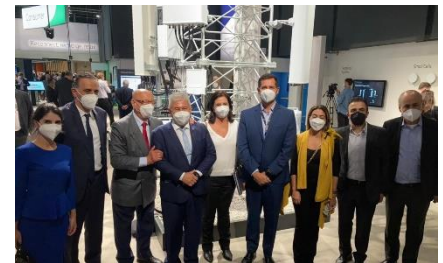
Ministério visita estande brasileiro no Mobile World Congress, em Barcelona