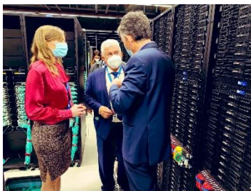
MCTI visita o Centro Nacional de Supercomputação, em Barcelona