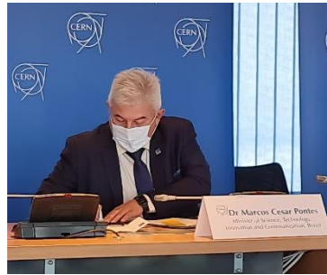
Governo Federal assina acordo de acesso do Brasil à Organização Europeia para a Pesquisa Nuclear (CERN)