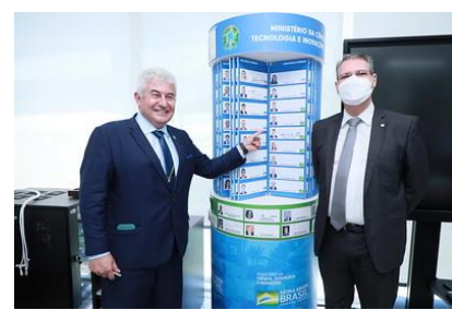
Ministro Marcos Pontes recebe o deputado federal Francisco Júnior (PSD/GO)