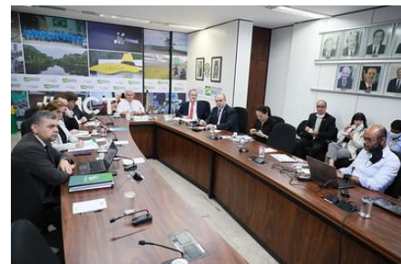
Reunião Mensal Conselho de Projetos MCTI