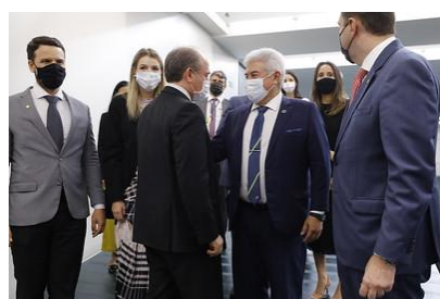
Participação no lançamento da Frente Parlamentar Mista da Inteligência Artificial na Câmara dos Deputados