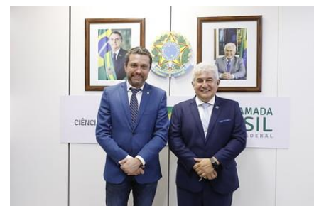
Ministro Marcos Pontes recebe o deputado federal Fausto Pinato (PP/SP)