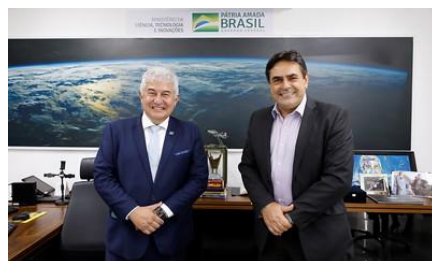
Ministro Marcos Pontes recebe o deputado federal Domingos Sávio (PSDB/MG)