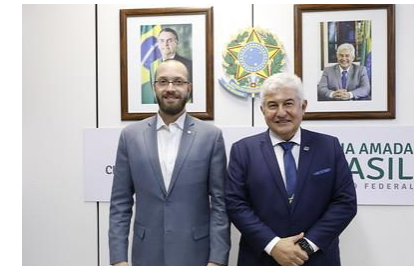
Ministro Marcos Pontes recebe o deputado federal Filipe Barros (PSL/PR)