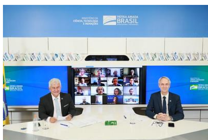
Cerimônia Virtual para assinatura de Memorando de entendimento