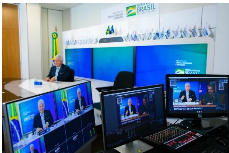
Entrevista Rádio Bandeirantes