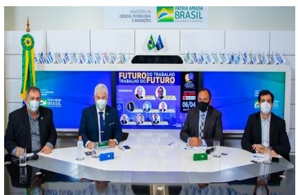
Ciência e Tecnologia no Dia a Dia