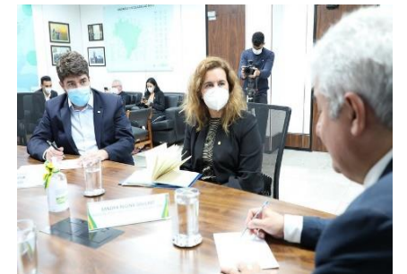
Deputado Zé Vitor (PL/MG)