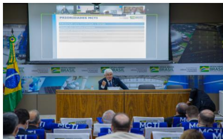
Comissão de Ciência e Tecnologia, Comunicação e Informática - CCTCI