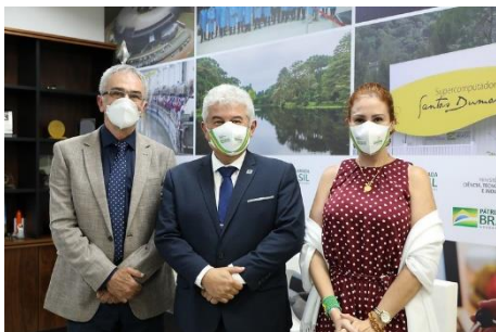
Dep. Federal Carla Zambelli (PSL/SP)