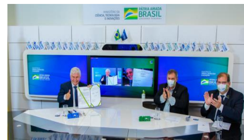
Acordo de Cooperação Técnica MCTI e SEBRAE