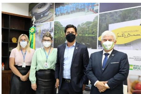
Senador Rodrigo Cunha (PSDB-AL)