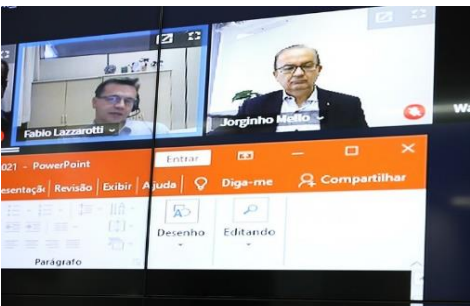
Senador Jorginho Mello - PL/SP