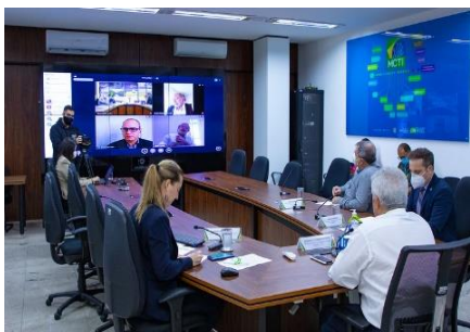
Fundação Instituto de Administração - FIA