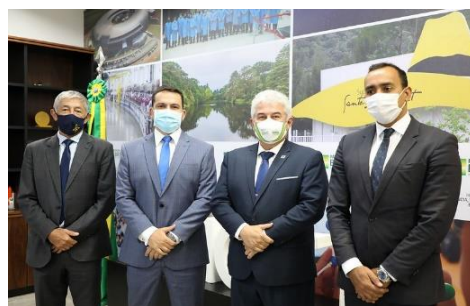
Dep. Federal Cap. Alberto Neto (Republicanos/AM)