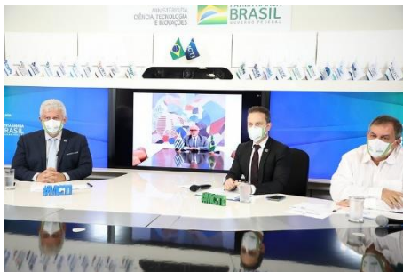
Embaixadores da América Latina e do Caribe